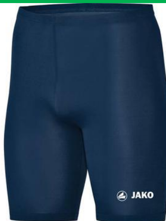
Tight Basic 2.0